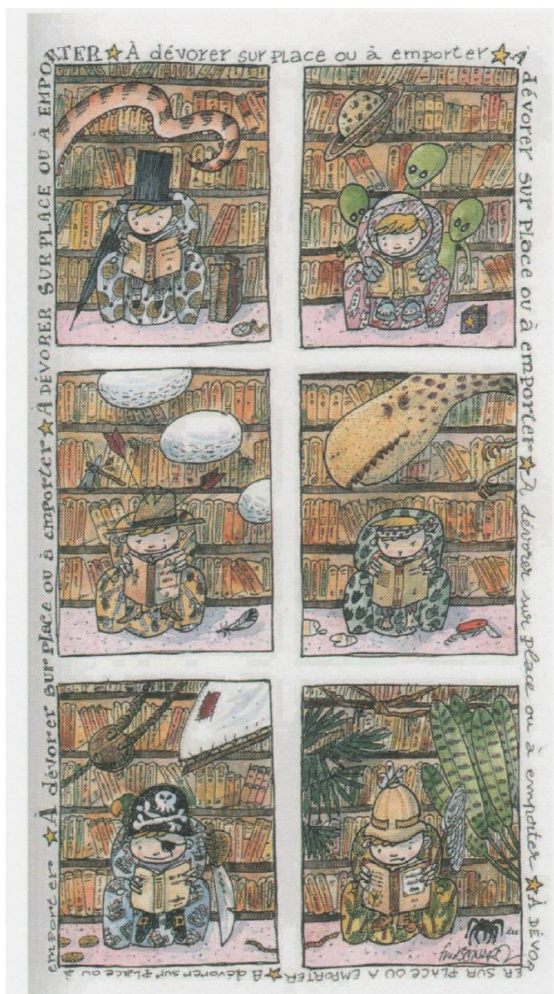
Illustration de Fred BERNARD, extraite de l'album de S. DEBORDE et C. FAUT, Livre de bibliothèque , p. 43, © Thierry Magnier, 2000.

5. Que représente cette illustration ? Que signifie-t-elle ?